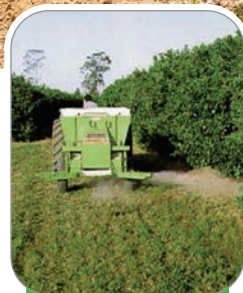
FINAIS DE RUA MORREDOUROS