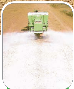
FAIXA TOTAL CALCÁRIO E GESSO