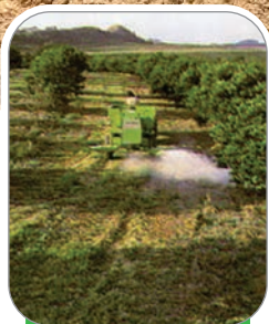
FALHAS E REPLANTAS