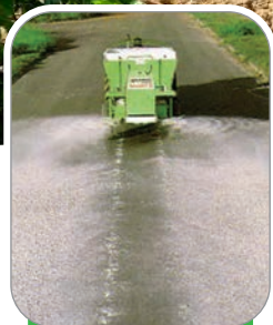
FAIXA LATERAL CALCÁRIO E GESSO