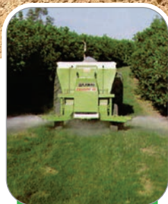
ADUBAÇÃO EM FAIXA